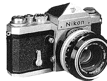
1959 Nikon F